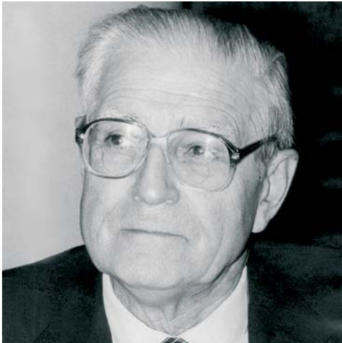
Prof. Aleksander Gieysztor (1916-1999)

Patron Nagrody prof. Aleksander Gieysztor, mediewista, jedna z najwybitniejszych postaci polskiej nauki II poł. XX wieku. Był prezesem Polskiej Akademii Nauk, członkiem Rady Fundacji Kronenberga przy Citi Handlowy, wybitnym polskim humanistą o międzynarodowej sławie, człowiekiem zasłużonym dla kultury polskiej.