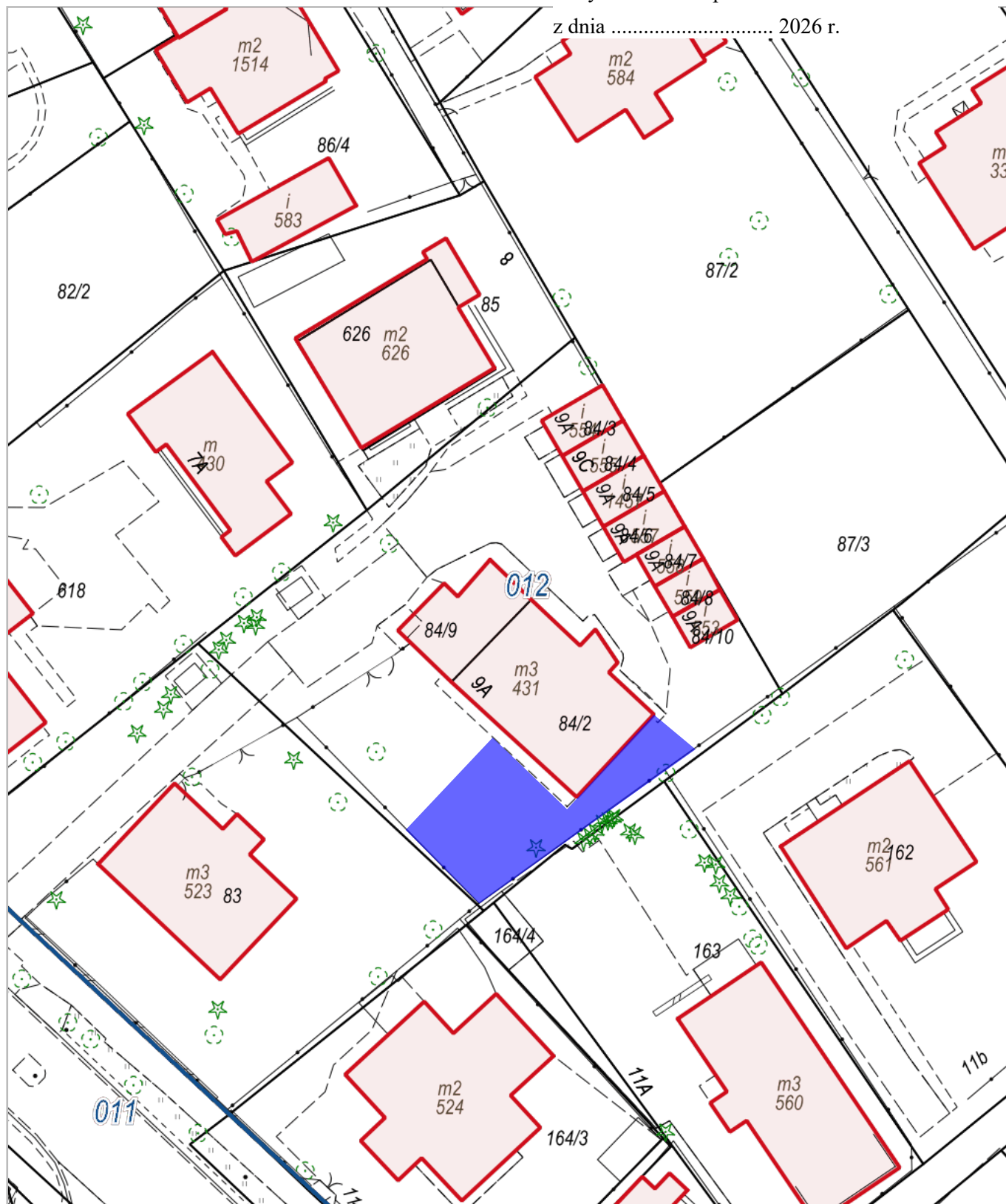
011, Zakopane | 012, Zakopane